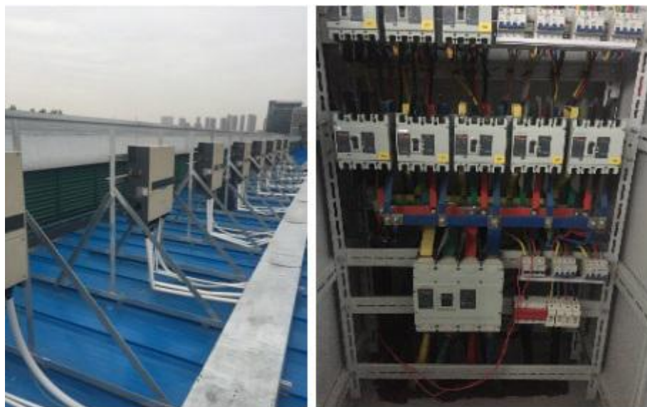
图2 光伏逆变器现场图片

而且已经通过了在太阳能光伏逆变器设备中极端恶劣环境下的稳定性实验，得到了客户的认可。