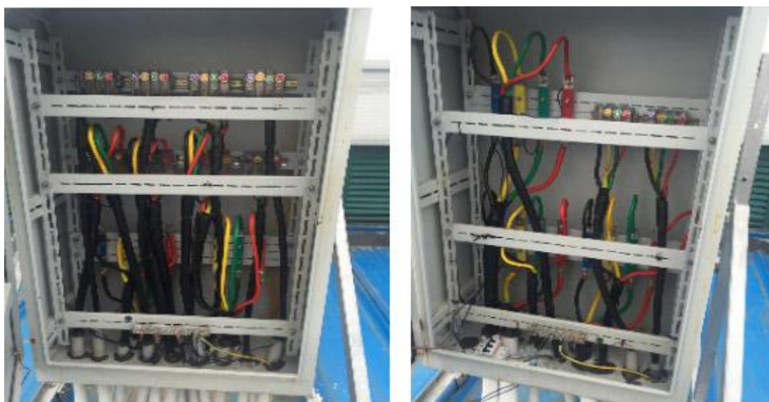
图3 光伏逆变器现场图片